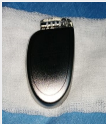
Figure 1. Exemple de boîtier de défibrillateur automatique implantable monochambre

Dans la majorité des cas, le dispositif est implanté dans la région pré-pectorale gauche, parfois en rétro-pectoral ou du côté droit ou même en intra-abdominal.