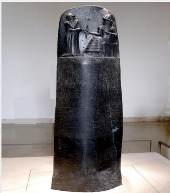
Figure 1. Code de Hammurabi gravé sur une stèle de 2,25 m

Le code d'Hammurabi, ensemble de lois inscrites dans la pierre par Hammurabi (1795- 1750 JC), traitait déjà de l'exercice de la médecine et des obligations des médecins. Le roi de Babylone, avait instauré ainsi le premier code éthique écrit régulant l'exercice médical. Le texte gravé sur les stèles a précisé que (Figure 1) : « A doctor causing the death of a slave would have to replace him », c'est-à-dire « Un médecin qui causerait la mort d'un esclave devrait le remplacer ».