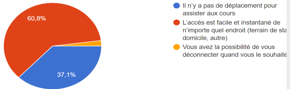
Figure 1. Raisons de surmotivation pour assister à l'enseignement à distance par rapport au présentiel.

Si vous êtes moins motivés pour assister à ce type d'enseignement par rapport au présentiel c'est parce que